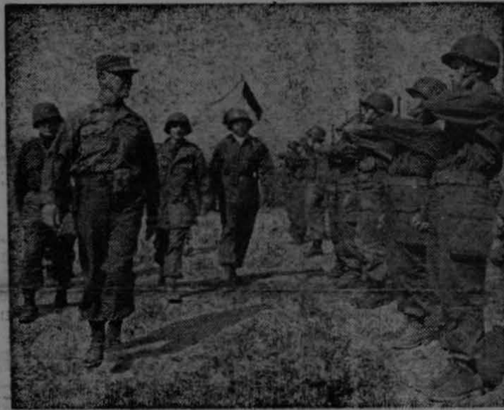
Aparece en esta fotografía el General James A. Van Fleet (a la izquierda), Comandante del Octavo Ejército de los Estados Unidos en Corea, pasando revista a las tropas francesas que cooperan con las fuerzas de las Naciones Unidas a combatir la agresión comunista en Corea.